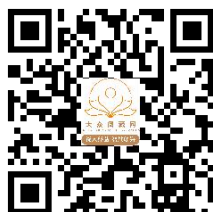
大众阅藏新浪微博